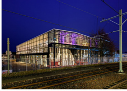
Şekil 13. LocHal Kütüphanesi Dış Cephesi Gece Görünüşü. (Kaynak: Civic Architects)

Gün boyunca gün ışığından yararlanan yapı, hava karardığında şehir için bir ışık kaynağı haline gelerek kent için odak noktası oluşturmaktadır (Şekil 13.).