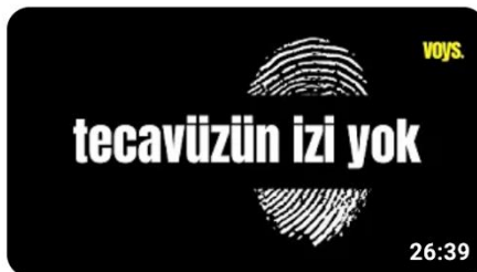
Tecavüzün İzi Yok